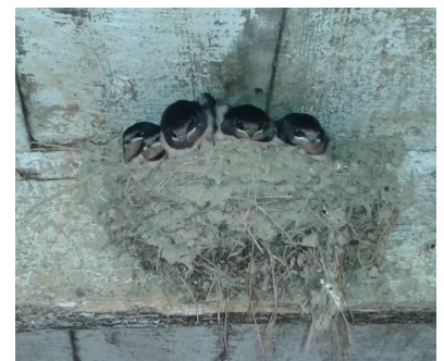
la famille Hirondelles